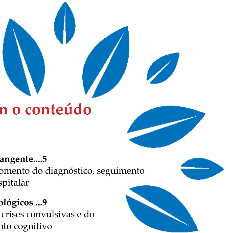
Tabela com o conteúdo